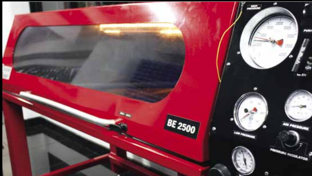
Centro de ensamble Hidroca Costa Rica P.26