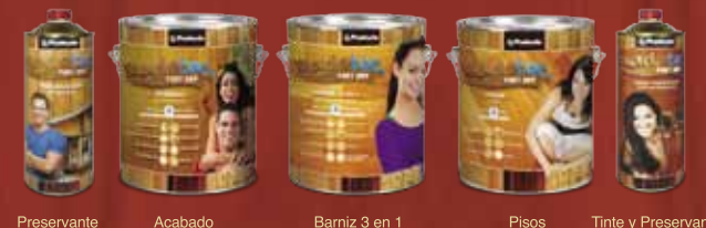
Preservante Acabado Barniz 3 en 1 Pisos Tinte y Preservante

Difícil de creer pero cierto, el barniz ya no huele.