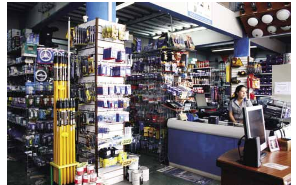
En el área de ferretería, el Depósito Arenal mantiene una combinación entre autoservicio con atención personalizada, lo que según sus administradores, les ha traído un aumento en las ventas.